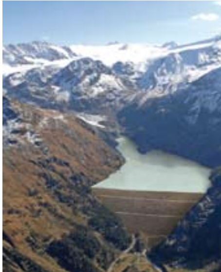
Die TIWAG untersucht derzeit auch einen Speicherstandort im hintersten Kaunertal im Bereich Fernnergries

Der Gemeinderat von St. Leonhard hat am 24. Juli dieses Jahres der TIWAG die Zustimmung für die Zufahrt in das Taschachtal zur Durchführung von Voruntersuchungen auf dem Grund der Agrargemeinschaft erteilt. Die Zustimmung der Grundeigentümer wurde bereits früher erteilt. Mit der erteilten Erlaubnis ist es der TIWAG möglich, Voruntersuchungen durchzuführen und damit die Eignung des Taschachtales als Speicherstandort auch im Detail zu überprüfen.