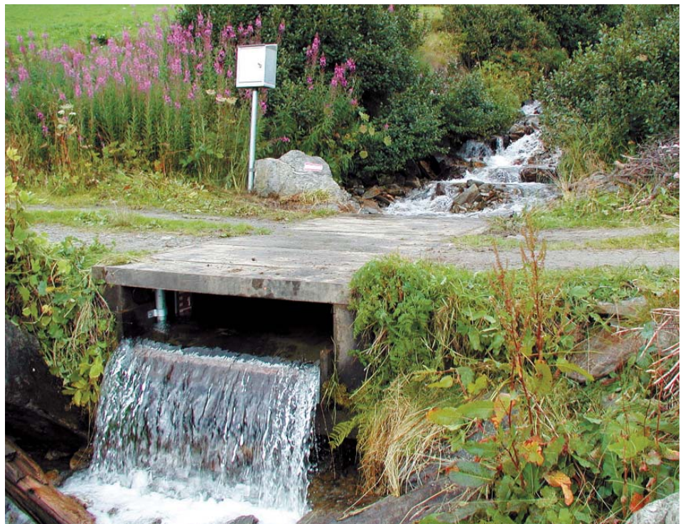
Auch die Wasserführung der Bäche wird gemessen.

TIWAG - Tiroler Wasserkraft AG Eduard-Wallnöfer-Platz 2 6020 Innsbruck T +43 (0)506 07-21142 F +43 (0)506 07-21714