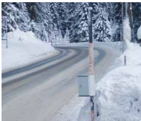
Für das Gutachten wurden umfangreiche Messungen durchgeführt.

stoffausstoß oder Erschütterungen erreicht oder überschritten werden.